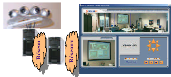
Figure 1. Architecture de Labvision.

Dans la première implémentation prototype que nous avons réalisée pour supporter le mode panoramique de la communication ambiante, la composition des flux vidéo provenant de trois à cinq caméras numériques USB permet une vision de 120 à 200 degrés « sans couture » de l'espace distant.